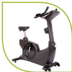
Matériel de fitness