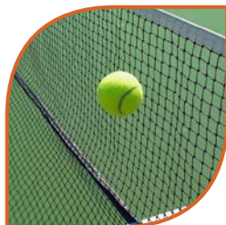
Filets de courts de tennis