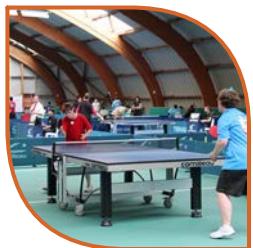
Tables de tennis de table

La taxe d'apprentissage est utilisée de façon efficace et performante :